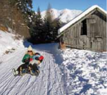
Roßkopf-Rodelbahn, mit 9,6 km die längste beschneite Bahn Italiens