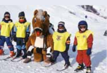
Roßkopf-Skikindergarten: ganztägige Betreuung (9.00 – 16.00 Uhr) bei viel Spiel und Spaß.