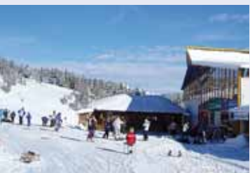
Kinderskikurse mit Zauberteppich, Carving- und Snowboardkurse ...